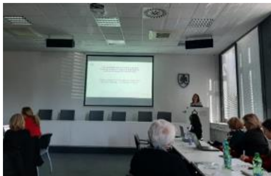
Vedecký park UK, Ilkovičova 8, Bratislava

Dňa 23. septembra 2022 prezentovala zamestnankyňa ONÚ OLAF na Diskusnom fóre: Vzdelávanie v oblasti finančnej gramotnosti v kocke tému OFZ EÚ a boj proti podvodom, ktorá je súčasťou výučby prierezovej témy Finančná gramotnosť na školách už od roku 2014. Organizátorom podujatia bol Štátny inštitút odborného vzdelávania, odbor Finančnej gramotnosti a Slovenského centra cvičných firiem a Úsek celoživotného vzdelávania. Partnerom podujatia bola Sektorová rada pre bankovníctvo, finančné služby, poisťovníctvo. V príspevku boli prezentované úlohy ONÚ OLAF a OLAF-u, ako aj vysvetlené základné pojmy, ktoré súvisia s témou OFZ EÚ a boja proti podvodom. Na praktickom príklade boli vysvetlené fázy protipodvodného cyklu. V príspevku boli uvedené trestné činy, ktoré sa týkajú poškodzovania finančných záujmov EÚ. V závere príspevku bol vysvetlený spôsob nahlasovania podozrení z nezrovnalostí a podvodov pri čerpaní prostriedkov EÚ. Viac informácií sa nachádza v tlačovej správe ONÚ OLAF zo dňa 28. 09. 2022.