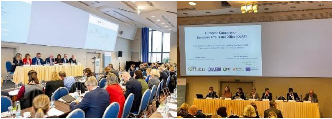
Konferencia EÚ: “Predchádzať - Odhaľovať - Vyšetrovať: Nové výzvy v boji proti podvodom a nezrovnalostiam vo výdavkovej oblasti”, Praha, dňa 23. 11. 2022 - 25. 11. 2022